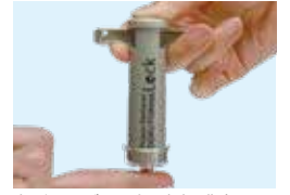
小口径は子どもの手や、大人の指向きです