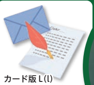
カード版 L (l)