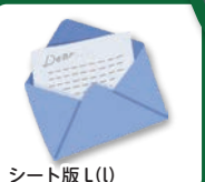
シート版 L (l)