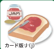
カード版 J (j)