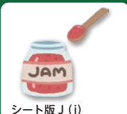
シート版 J (j)