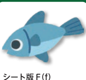
シート版 F (f)