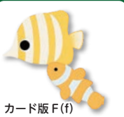
カード版 F (f)

カードとシートのイラストはそれぞれ少しずつ違うものなので、考えながら楽しく結びつけられます。