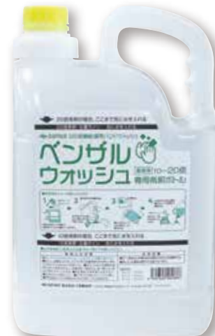
ベンザルウォッシュ専用希釈ボトル