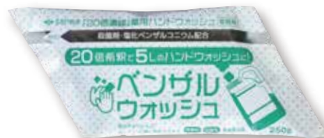
20倍濃縮薬用ハンドウォッシュ ベンザルウォッシュ