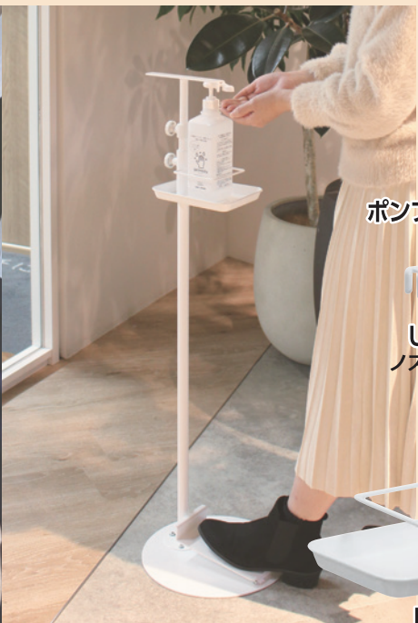
落下防止リング (内寸) W9.2×D9.2cm