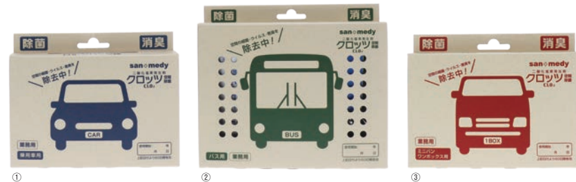
大型バスも1箱でカバー！空気の流れが多い前方配置でより効果的に除菌。