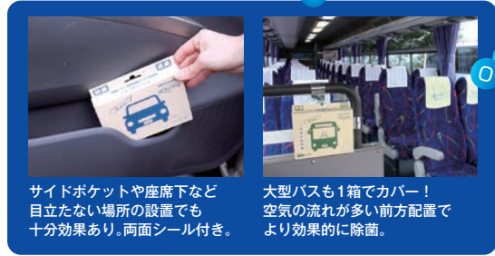
サイドポケットや座席下など目立たない場所の設置でも十分効果あり。両面シール付き。