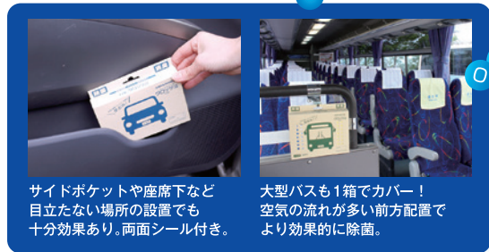
サイドポケットや座席下など目立たない場所の設置でも十分効果あり。両面シール付き。