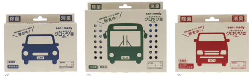
大型バスも1箱でカバー！空気の流れが多い前方配置でより効果的に除菌。