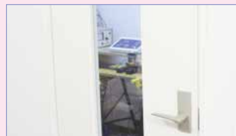
当社テクノセンター無音室