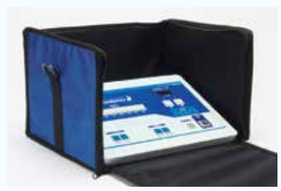
検診の際の目かくしとしてもご利用いただけます。

オーディオメータ専用ケース 商品コード: 913-313 価格: ¥15,000 (税込 ¥16,500) 【サイズ】幅31×奥行25×高25cm【重量】765g 【材質】ナイロン、ポリプロピレン