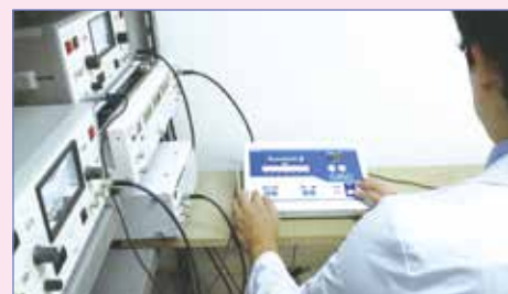
専門スタッフによる丁寧な校正