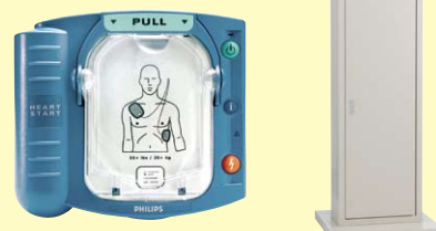
ハートスタート HS1 AED 収納ケース (スタンドタイプ)

AED (自動体外式除細動器) ハートスタート HS1 HEARTSTART HS1